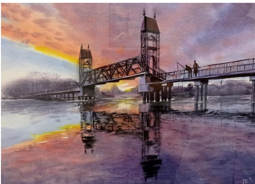
Елена Пушина «Мост в закат» Бумага, акварель 38 x 28 см 2022 г