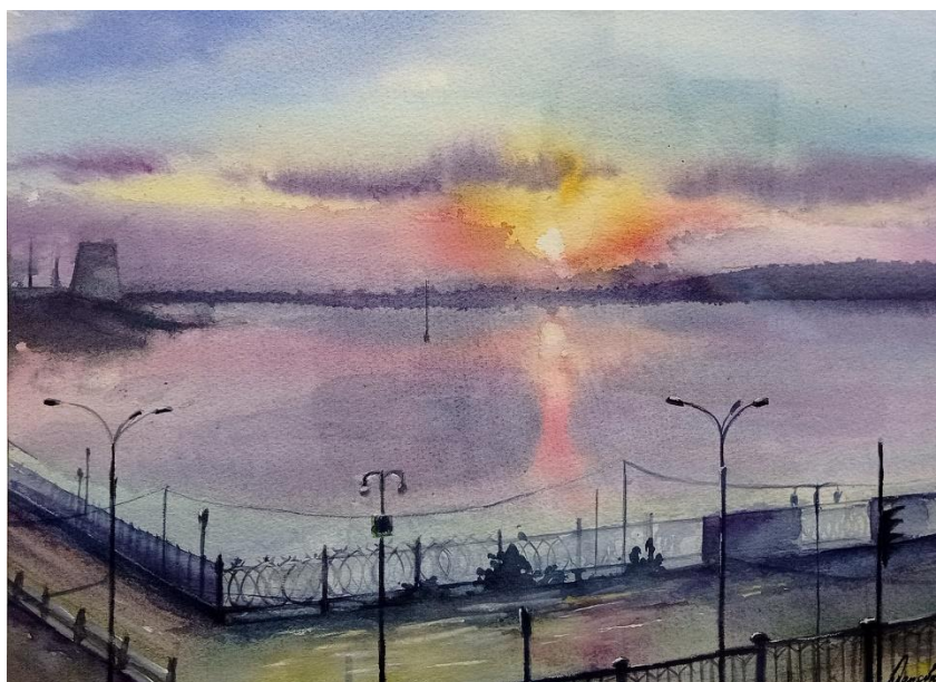
Анна Попова «Закат - это вступительная музыка ночи» Бумага, акварель 38 x 28,2 см 2022 г