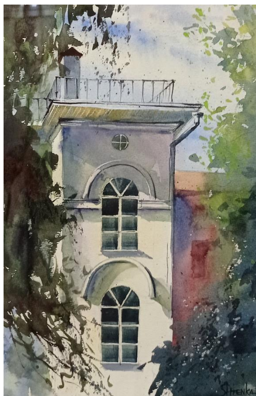
Елена Штенникова «Субботний денёк» Бумага, акварель 26,8 x 38,7 см 2021 г