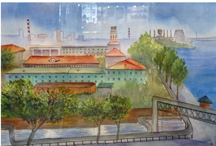
Яна Башак «Завод - исток Ижевска» Бумага, акварель 38,7 x 26,8 см 2022 г