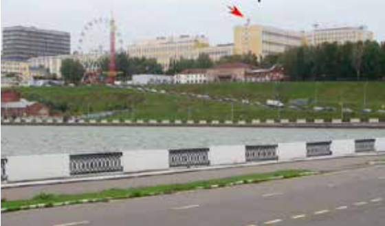
Рис.6 Собор не виден с набережной