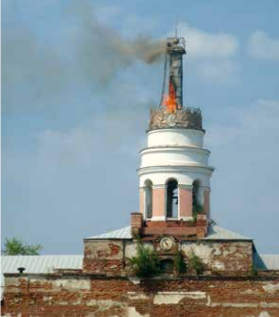
Рис.1. 03 июля 2018 12 часов 45 минут