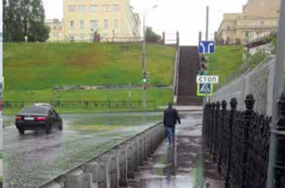
Рис.4 Сливной тротуар

ных колёс. Два из четырёх этажей Главного корпуса находятся ниже уровня воды в пруду. Это, кстати, препятствует обзору одного из первых многоэтажных промышленных зданий России. Вековые тополя и чугунная ограда с колючей проволокой тоже не способствуют обзору. Как бы ни ратовали защитники природы за сохранение деревьев, очевидно, что старые тополя не только загромождают памятник истории, но и представляют реальную угрозу. Сильный ветер уже не раз ломал ветви и валил деревья. Но главный источник проблем, конечно, не природа, а сам человек. После реконструкции плотины вдруг оказалось, что пешеходная дорожка стала сточной канавой – через неё во время дождя все сточные воды с крутых склонов улиц Ленина и Милиционной по проекту должны под ногами заводчан стекать сквозь ограду в Иж (Рис.3, 4). В царское время уважали спешащих на завод мастеровых, и в плотине были предусмотрены специальные отверстия для слива.