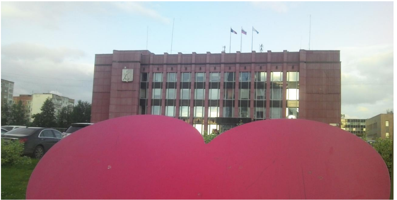
Рис.8. С приветом из Ижевска!