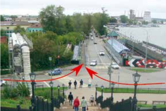
Рис.3 Сточные воды под ноги людям