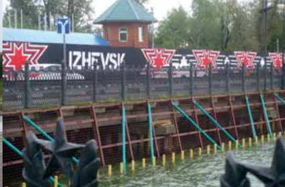
Рис.7 Ижевск на экспорт

чувство меры и вкуса. В Ижевске всё время появляются новые интересные объекты: крокодил, космическая собачка, учёный кот под дубом, трубач на Пушкинской. Но есть сомнительные «конструкции». Отдаёт провинциальностью установка в Вишнёвом сквере чёрной модели Эйфелевой башни. А огромная красная фигура перед мэрией (особенно зимой, когда нижняя её часть под снегом) откровенно смахивает на «пятую точку» (Рис.8). И если «отцы» города смотрят на горожан из окон своих кабинетов через эту самую «точку зрения», то и ижевчане отвечают им тем же, проезжая мимо. Недавнее благоустройство «пятой точки» в виде укладки вокруг неё тротуарной плитки подтверждает осознанный выбор приоритетов. Также вызывает сомнение памятник в сквере у мэрии графу П.И.Шувалову. Тщеславный проходимец государственного масштаба, он проводил законы, выгодные собственному бизнесу, и хотя был владельцем Ижевского завода, никогда здесь не бывал и смутно представлял, где этот завод находится.