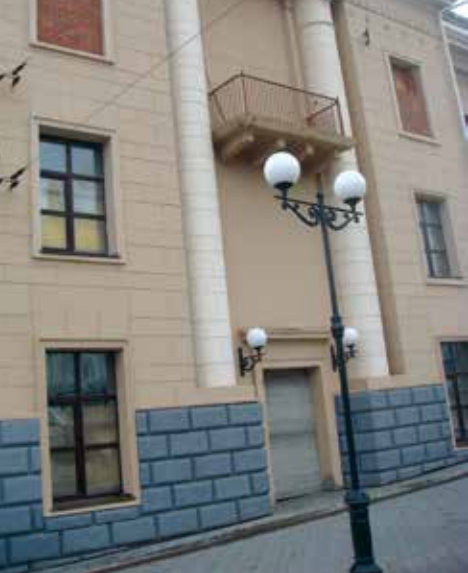
Рис.5 Замурованный фасад Русского театра

Но даже когда берёмся за благое дело восстановления утраченных памятников, результат радует не всегда. В 2007 году заново построили Михайловский собор на Красной горке. Как и 100 лет назад в 1907, когда заводчане собрали деньги на храм к 100-летию юбилею ижевского оружия, основной вклад в строительство в наше время внесли оборонные заводы. Но градостро-