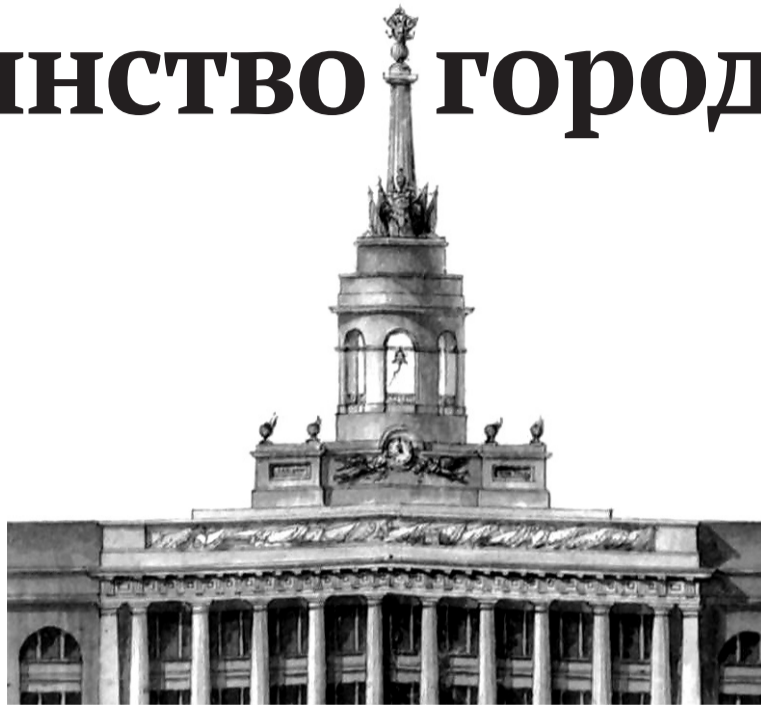
Заводская башня на копии с подлинника проекта С.Е. Дудина (1810).

Когда Андреян Захаров строил в Санкт-Петербурге Адмиралтейство, у него трудились семь скульпторов и художников-декораторов, применялись дорогие отделочные материалы. Главный корпус в Ижевске имеет единственную декоративную композицию, венчающую заводскую башню. Интерпретация символики этой группы как «попирание «триумфальной»